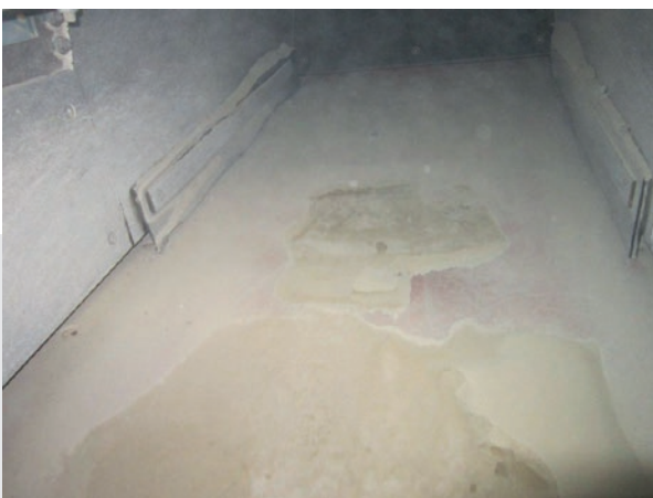
Ansicht 1 - Förderrinne mit PUCEST Verkleidung, nach 4 Monaten Dauerbelastung

Eingesetzt z. B. hier als Vibrorinnenbelag, führen die Eigenschaften der Hybridplatte zu einem optimalen Förderergebnis.