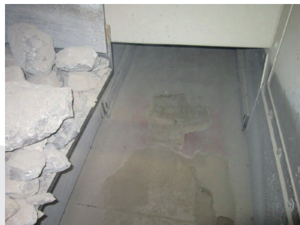
Ansicht 2 - Förderrinne mit PUCEST Verkleidung, nach 4 Monaten Dauerbelastung